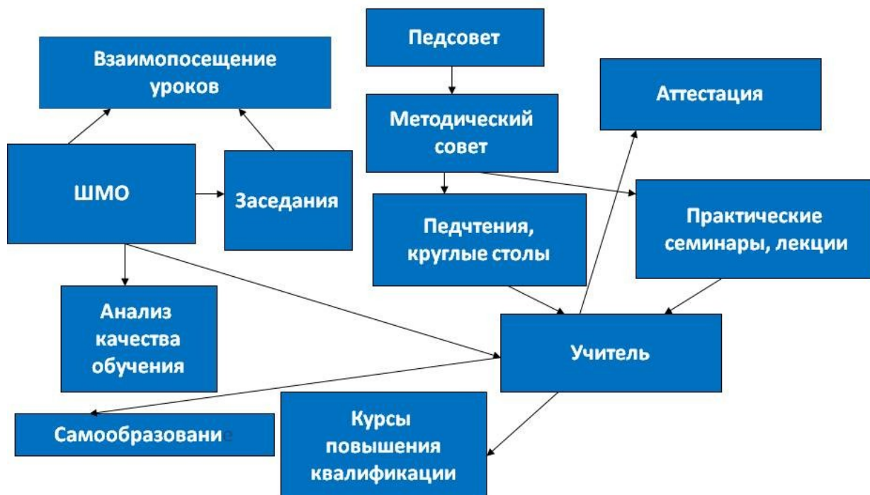
Схема структуры методической службы школы

4.7. Методическая тема ОУ, цели и задачи методической работы, основные направления, результаты.